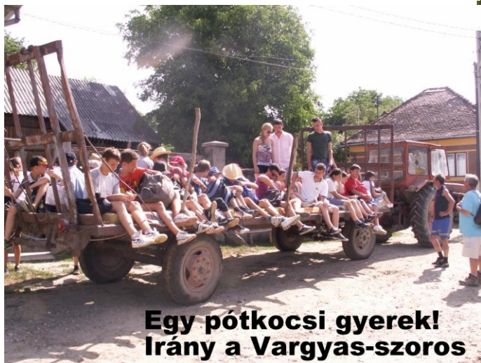
Egy pótkocsi gyerek! Írány a Vargyas-szoros