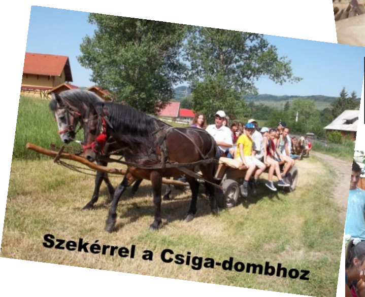
Székérral a Csiga-dombhoz

„Sok székelykaput és az elkészítésüket is láhattuk. Csodálatos tájakat és embereket ismerhettünk meg, a kézműves ipar remekeiben gyönyörködhettünk.”