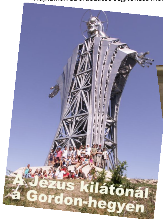
A Jézus kilátónál a Gordon-hegyen