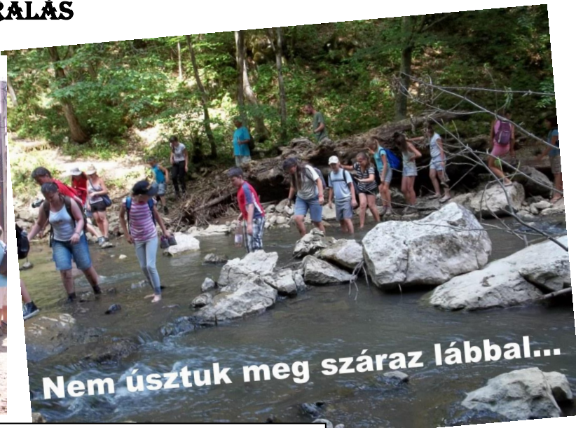
Nem úsztuk meg száraz lábbal...

„Az Almási barlangnál részben izgalmas, részben félelmetes volt. Vicces volt, amikor többször is átmentünk a Vargyas patakon.”