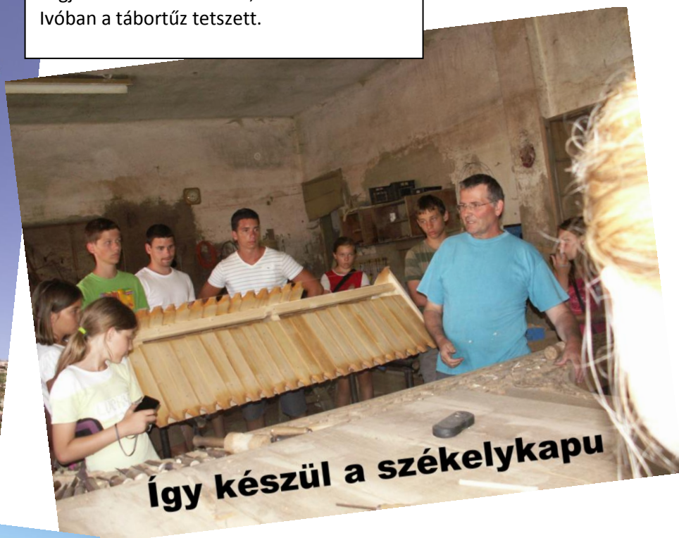
Így készül a székelykapu

Igazi Xtrém kiránduláson vehettünk részt. Legjobban a traktorozás, a Jézus kilátó és Ivóban a tábortűz tetszett.