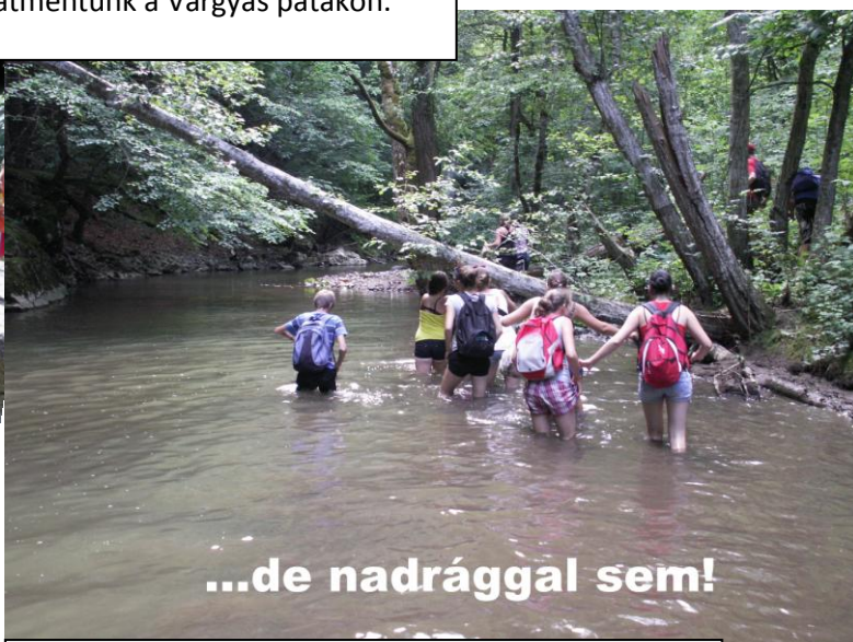
...de nadrággal sem!