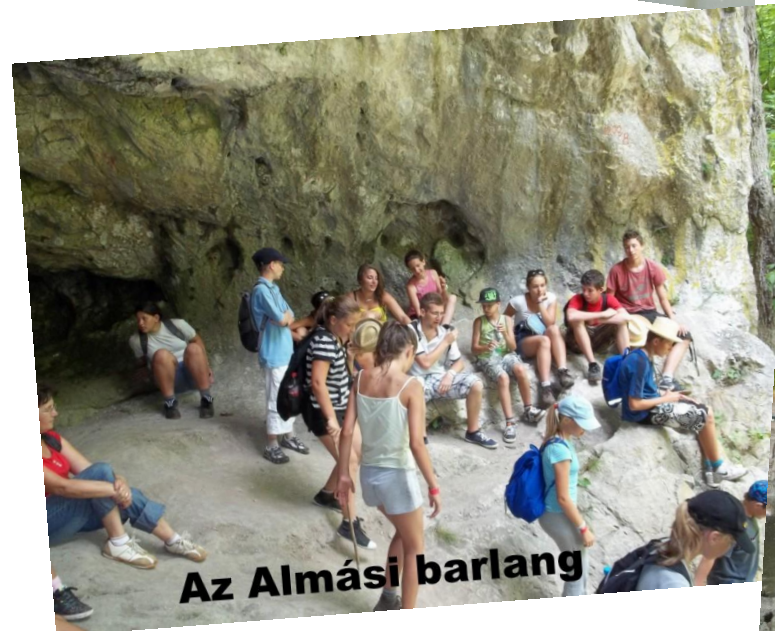
Az Almási barlang