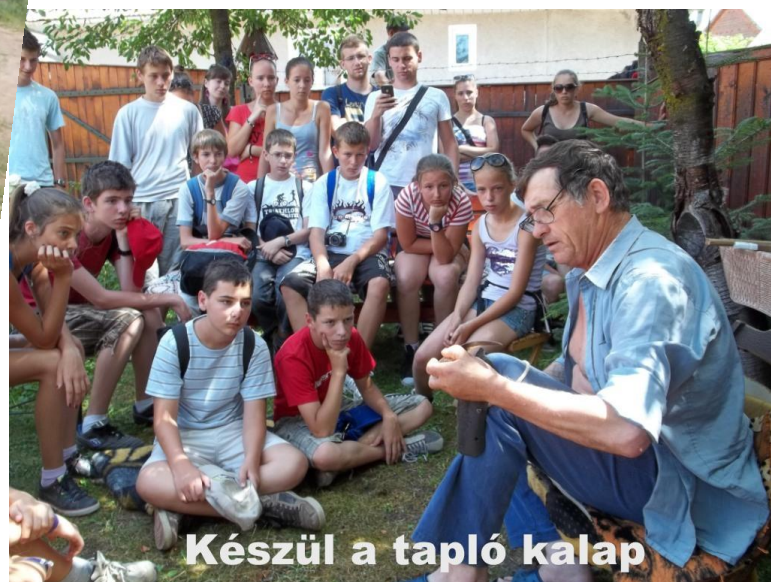
Készül a tapló kalap

„Kellemes volt itt lenni, az emberek mindenhol nagyon kedvesek voltak. Köszönjük a lehetőséget.”